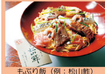
もぶり飯(例:松山鮭)

平成16年度から実施の城山公園(堀之内地区)第1期整備が完了し、4月3日から一般開放しています。堀之内地区では、キャッチボールなどの軽スポーツや犬の散歩など、公園の利用について9月30日までを試行期間として、市民の皆さんからアンケートを募集します。