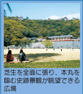
芝生を全面に張り、本丸を臨む史跡景観が眺望できる広場