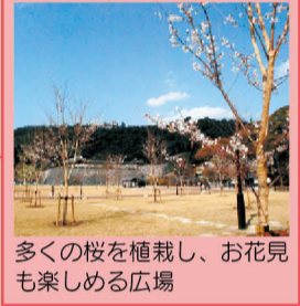
多くの桜を植栽し、お花見も楽しめる広場