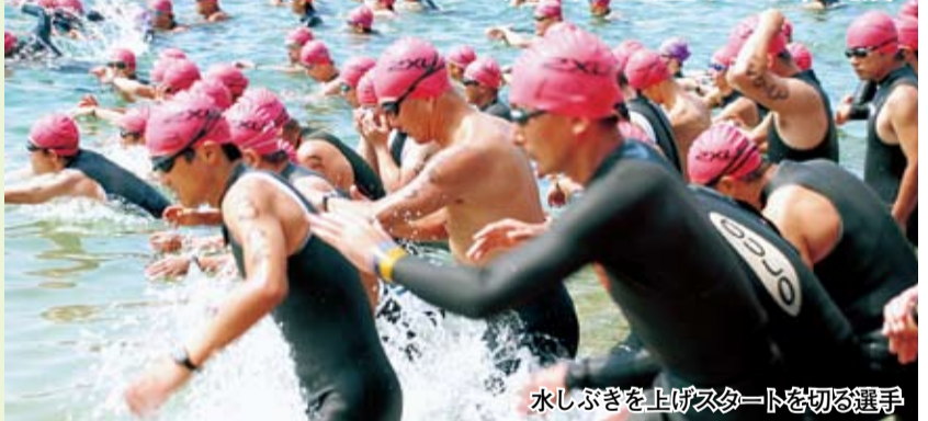
水しぶきを上げスタートを切る選手