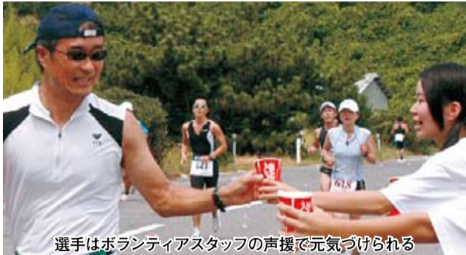
選手はボランティアスタッフの声援で元気づけられる

発行：松山市役所／編集・総合政策部広報課／毎月1日・15日 ☎948-6705・FAX934-2578・http://www.city.matsuyama.ehime.jp/