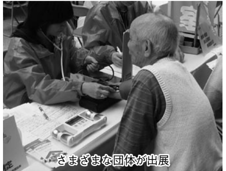
さまざまな団体が出展

【日時】10月16日(土)・17日(日) 10時～16時 【場所】大街道商店街(アーケード内) 【参加要件】市内を中心に活動や運動をする団体で、消費生活に密着した出展内容 【参加料】無料 【ブースのスペース】360センチ×200センチのスペース。必要に応じて展示台(幅180センチ×90センチ、高さ70センチの机2台)や、いす(6脚程度)を事務局が用意します 【申し込み】4月1日(木)～5月7日(金)(必着)までに、直接または郵送、ファクス、eメールで所定の申し込み用紙(みんなの生活展事務局へ市役所本館1階・消費生活センター内)にあります。市ホームページからもダウンロードできます(必要事項を書いて、〒790-8571「みんなの生活展事務局」、shohi@city.matsuyama.ehime.jpへ) ※出展の可否を考慮し、結果を7月中旬までにお知らせします