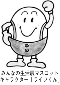
みんなの生活展マスコットキャラクター「ライフくん」

消費生活のあり方や環境への配慮、また心身の健康についてよく考え、市民がより豊かな暮らしが見い出せるよう、設けられたブースで、参加団体がさまざまな情報提供を行います。