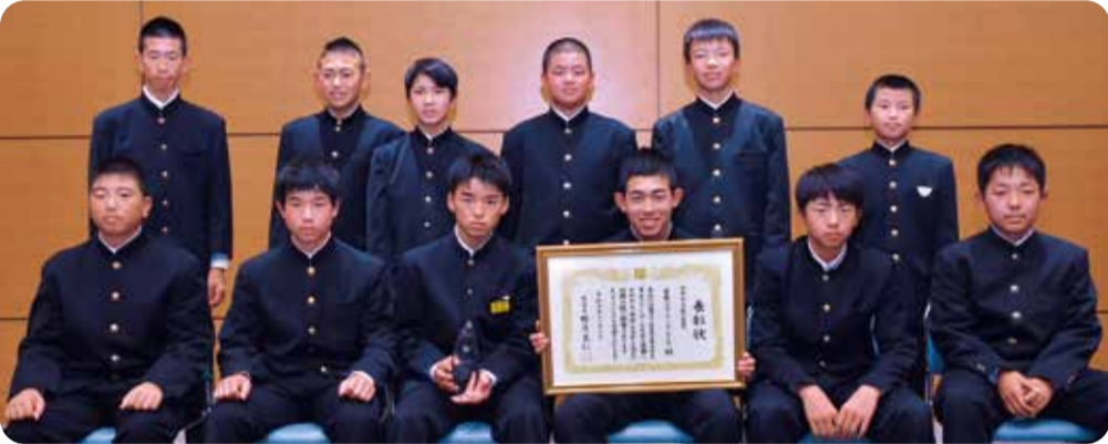
愛媛ジュニアソフトボールクラブ