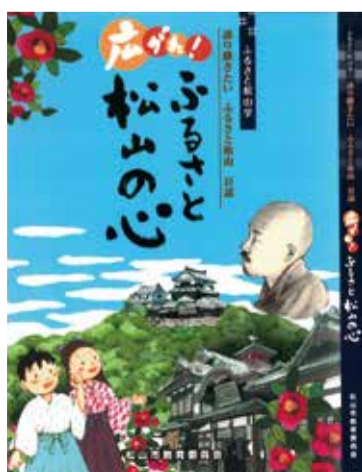
ふるさと松山学 書籍の表紙

企業版ふるさと納税は、地方公共団体が行う地方創生の取り組みに企業が寄付をした場合に、税制上の優遇措置が受けられる制度で、本社が所在しない地方公共団体への寄付が対象です。本市は、制度を積極的に活用し、企業の皆さんに賛同いただける魅力ある取り組みを進めます。