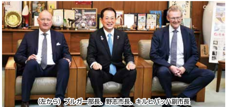
(左から)ブルガー部長、野志市長、キルヒバッハ副市長