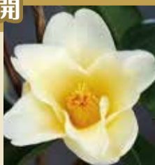
子規 (伊予つばき協会 認定132号)

期間 1月28日(土)～2月10日(金) 会場 子規記念博物館(道後公園)1階ロビー入り口 問い合わせ 子規記念博物館☎931-5566・FAX 934-3416