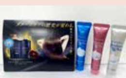
配布するサンプル

日程 1月28日(土)・29日(日) 会場 道後温泉別館 飛鳥乃湯泉(道後湯之町) 対象・定員 飛鳥乃湯泉の利用者。各日128人(先着順)