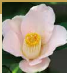
律 (伊予つばき協会 認定133号)