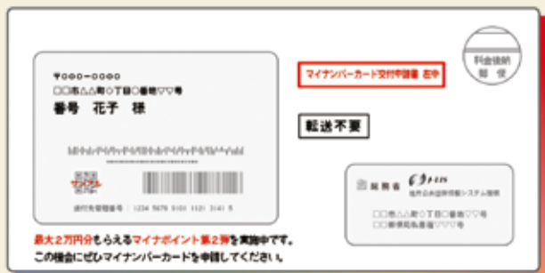
国が送付している封筒