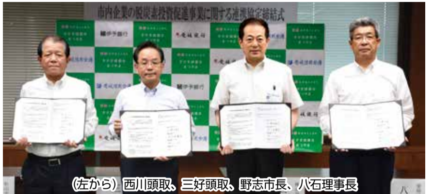
(左から) 西川頭取、三好頭取、野志市長、八石理事長