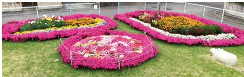
市長賞に輝いた【別府清水西団地公園】の春花壇