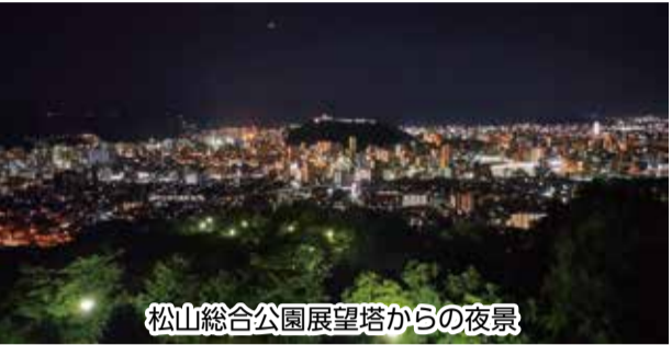
松山総合公園展望塔からの夜景

松山総合公園は二つの展望塔のほか、それらを結ぶ2階の渡り通路、芝生広場など、景観を眺められる場所の豊富さが魅力の一つ。3階の屋上展望台からは360度を見渡せ、市街地や松山駅周辺の繁華街、松山城のライトアップも一望できます。