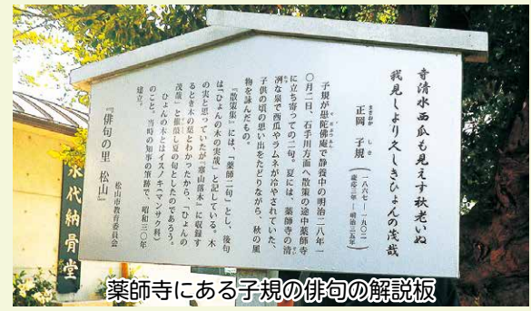
薬師寺にある子規の俳句の解説板

昔、大きな泉があり、正岡子規も少年時代にここに遊びに来ています。境内には、子規が薬師寺で詠んだ句「寺清水西瓜も見えず秋老いぬ」「我見しより久しきひよんの茂哉」の句碑があります。子規が「茂」と詠んだのは、昆虫が産卵してできた「虫こぶ」のことだそうです。このイヌノキ(ヒヨノノ