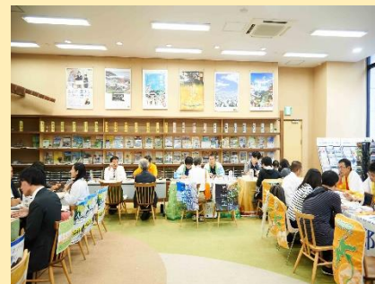
移住＆お仕事相談会 (東京都 移住・交流情報センター)