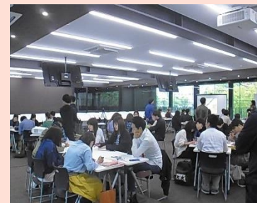
松山アーバンデザインスクール開催