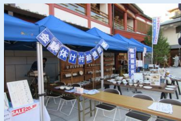
飛鳥乃湯泉中庭イベントでの砥部焼絵付け体験&即売会