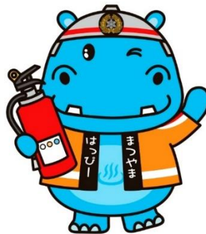
松山市:はっぴーカバー君