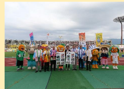
愛媛FC「松山広域デー」 (ニンジニアスタジアム)