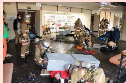
中予地区消防長会合同訓練