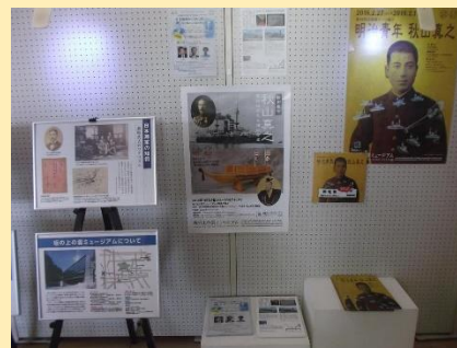
秋山真之ポスター・パネル展 (伊予市立図書館)