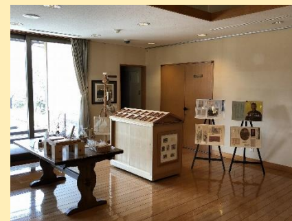
坂の上の雲ミュージアム出張展示 (久万高原町・久万美術館)