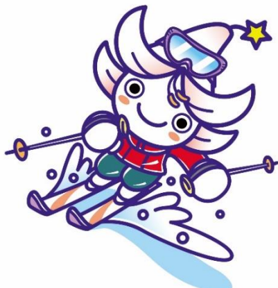
久万高原町:ゆりぼう