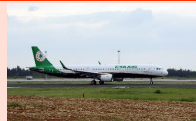
「エバー航空」台湾便就航