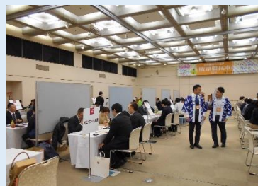
松山圏域中小企業販路開拓市