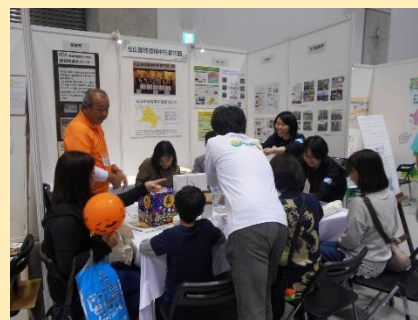
環境フェア (アイテムえひめ)