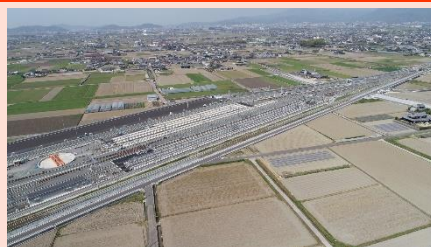
南伊予駅・JR車両基地