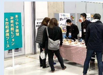
「まつやま農林水産まつり」での6市町連携ブース