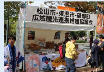
ひろしまフードフェスティバルでの松山・東温・砥部観光ブース