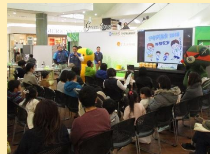
アクア博士体験教室 (エミフルMASAKI)