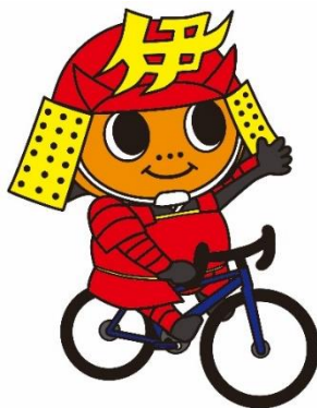
伊予市:ミカンまる