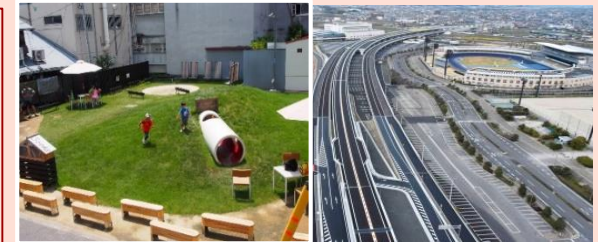
松山アーバンデザインスクール圏域内開催 松山外環状道路の延伸（広域的公共交通網整備）

大学連携等で連携の動きが見られる。今後は、外環状線・JR松山駅等の整備や空港利用促進を広域公共交通網としてどのように接続し活用していくかなどの検討が必要。