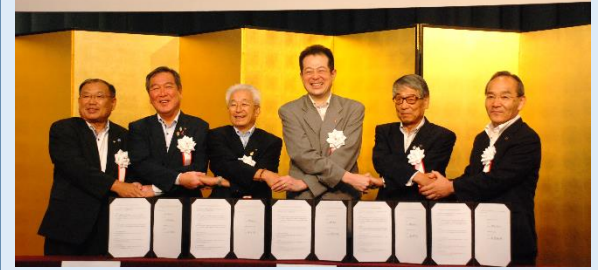
連携協約締結（平成28年7月8日）