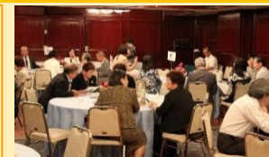
圏域在住の未婚者の親が参加し子のお見合い相手を探す婚活交流会

こどもの救急ガイドブックの圏域配布、病児・病後児等の広域受入や婚活イベント、スポーツイベント等の連携をはじめ、複数の個別協定締結が成立するなど成果の大きい分野となっている。今後は、より深い連携を実施するための圏域内での協議や、進捗の浅い分野での実績づくりが必要。