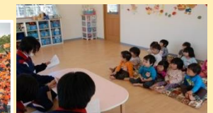
病児・病後児保育の広域受入