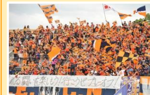
松山・中予「広域の日」