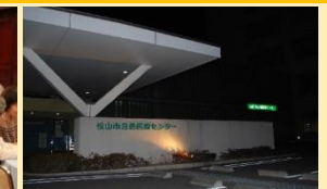
松山医療圏救急医療市町連絡会を開催