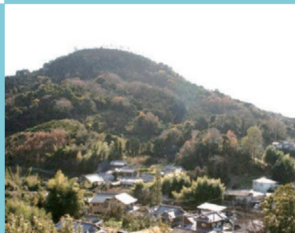
地区のシンボル宅並山