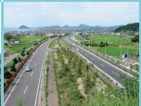
幹線道路が走る栗井地区