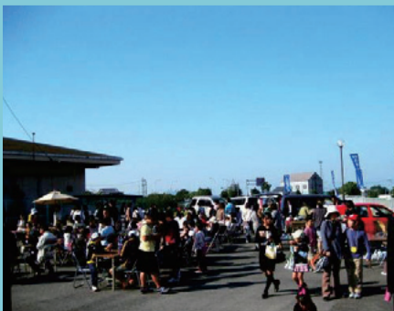
ふれあいマーケット