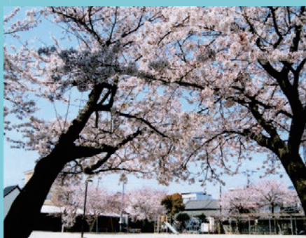
憩いの場所 ひがしまちうら 東町浦公園