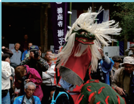
伝統が継承される獅子舞