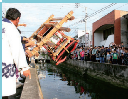
みょうじょうがわ 明星川でのみこしみそぎ