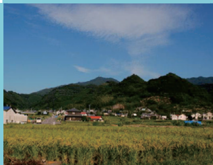
河野氏発祥の地 河野地区