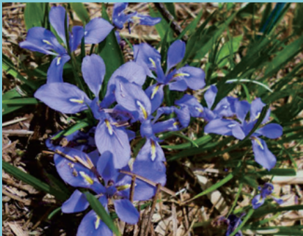
腰折山に咲くエヒメアヤメ