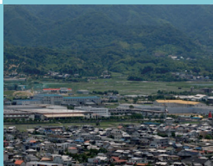
多くの企業が集まる工業団地