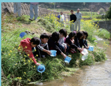
ホテルの幼虫の放流