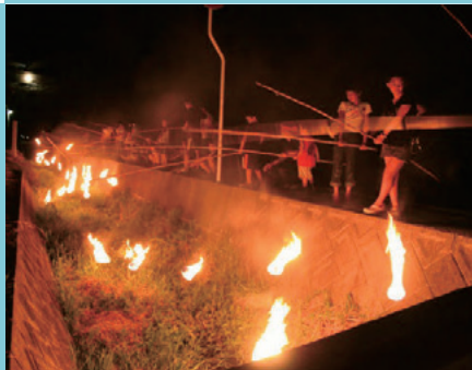
お盆の行事、火やろ