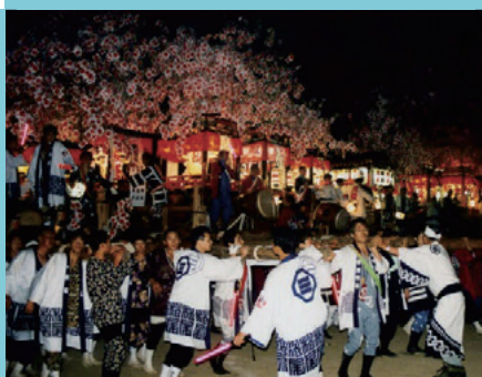
かざはやひのこと 風早火事祭り