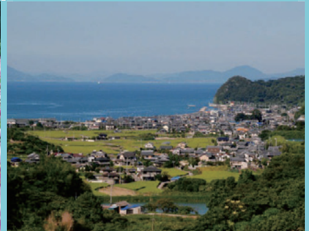
鴻之坂から望む浅海地区