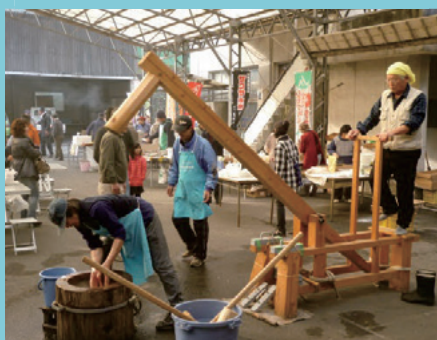
地区内外の人が集まる山麓市 さんろくいち