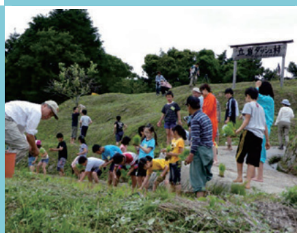
自然学習体験の立岩ダッシュ村