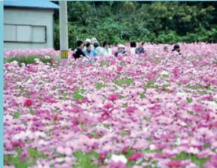
住民手づくりのコスモス畑