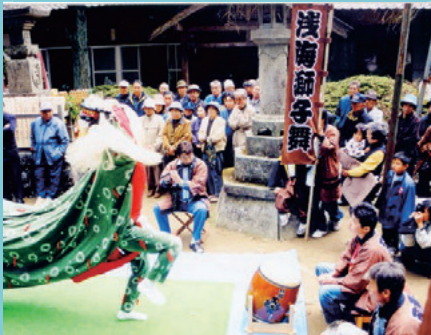
伝統が継承される獅子舞