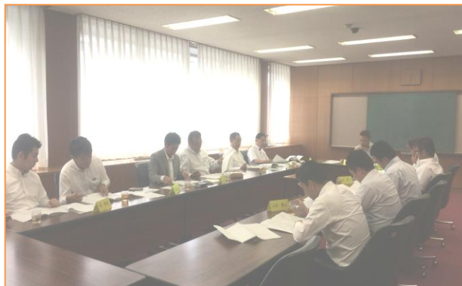
(打ち合わせ会の様子)