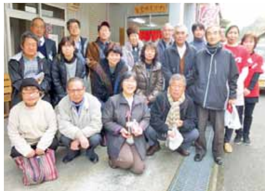
農家レストラン「食堂ゆすかわ」前にて

2月25日(水)に松山地区の家族経営協定締結農業者を対象とした研修会を西予市城川町の遊子川地区で開催いたしました。 研修会では、特産品加工施設や農家レストラン等の視察のほか、遊子川公民館で地域活性化組織「遊子川もりあげ隊」や同隊の特産品加工班の活動、農業の6次産業化への取り組みについて説明を受けました。 また地元のとまと栽培農家と家族経営協定を通じた農業経営の合理化、近代化について意見交換を行いました。