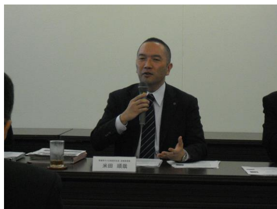
平成27年度第2回中小企業振興円卓会議