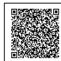
賃上げ応援奨励金 申請フォーム

https://apply.e-tumo.jp/city-matsuyama-ehime-u/offer/offerList_detail?tempSeq=3259