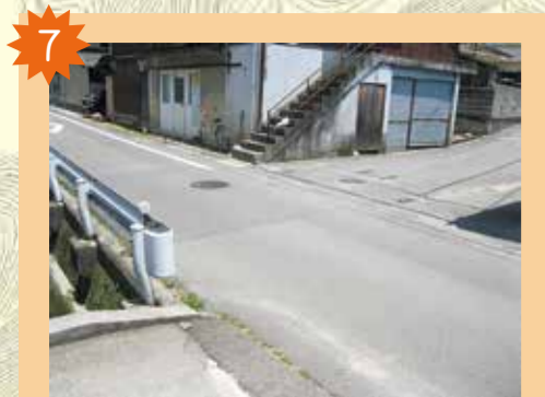
祝谷郵便局前交差点 カーブミラーがない。見通しが悪い車のスピードが速くて危険。