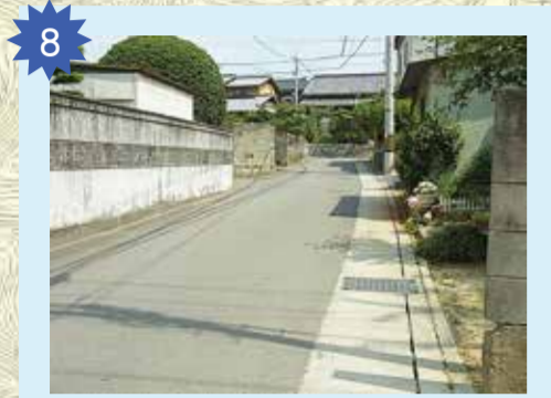
コモダマンション北西の路地 道幅が狭く、家の塀や柵で見通しが悪い。