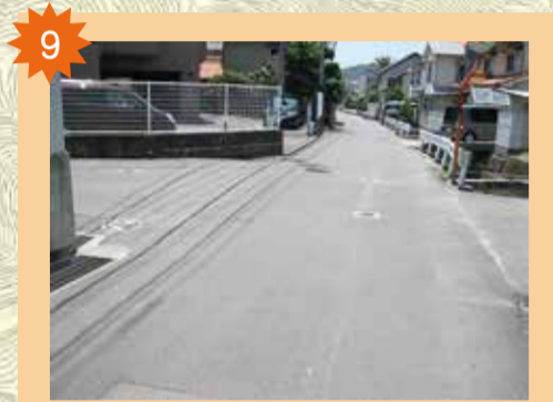
アドラーフル前交差点 坂になっているため自転車がスピードを出して通っていく。狭い道なのに大きな車がスピードを出して通る。