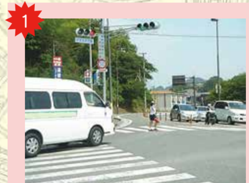
珈琲前交差点 車の量が大変多い。時差式信号なので注意。車に巻き込まれそう。