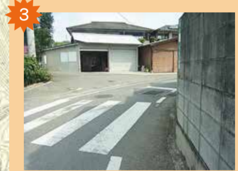
祝谷4丁目緩やかなカーブ 坂道で危険。カーブミラーを見ないと下ってくる車が見えない。