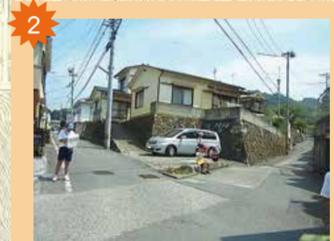
祝谷集会所北三叉路 カーブミラーを見ていると三箇所のどこから車がかかるかわからない。道幅が狭く、車の融合に巻き込まれそう。