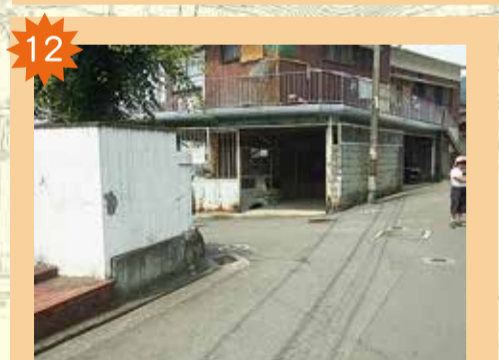
祝谷2丁目・道後緑台の路地 曲がり角や交差点が連続して、見通しが悪くて危険。