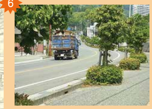
ローソン前のバイパス 上り下りともに、車が見えにくい。駐車場にたくさん車が出入りするため危険。