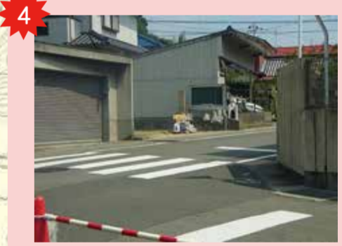
西/側集会所前横断歩道 二車線で車の量が大変多い。なかなか車が止まってくれない。