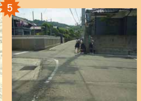
二宮商店前交差点 S字型の道路になっているため見通しが悪い。朝の時間が1番車の量が多い。バイクもたくさん通っている。