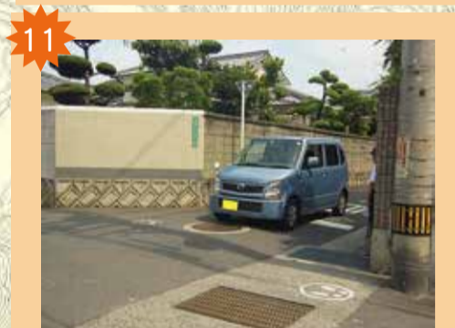
コモダマンション南交差点 見通しが悪く、左右をよく確認しないと危険。