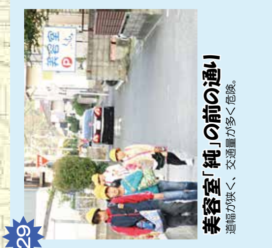
29 美容室「純」の前の通り 道幅が狭く、交通量が多く危険。