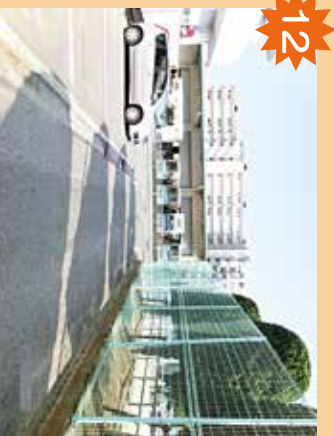
山越公園北側 人通りが少なく、不審者が出発することがある。公園での遊び方、持ち物の管理に注意。