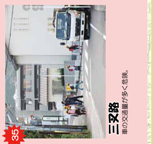
35 三叉路 車の交通量が多く危険。