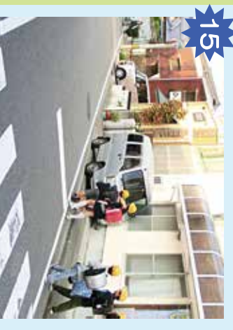
坂道下歩道 カーブになっていて視通りが悪いうえに、よく車が通り、要注意。