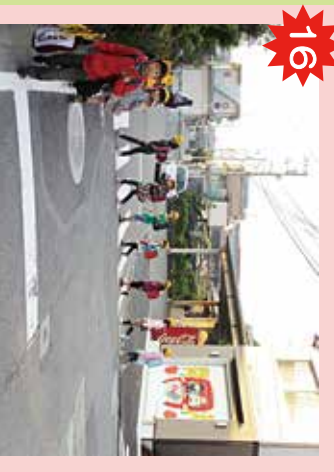
消防ポンプ蔵置所 狭い道だが、車のスピードが遅くて危険。