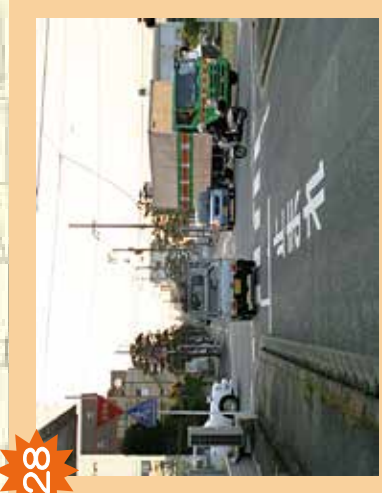
28 交差点 交通量が多いが、信号機がなく危険。