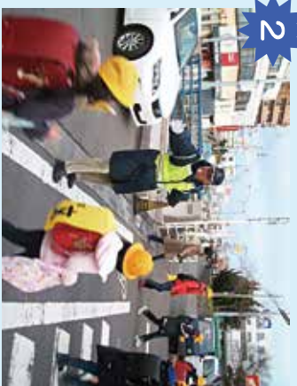
パインコ北側の歩道 自転車や車などの交通量が多いので注意。