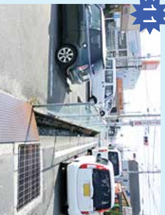
愛花の横の用水路 交通量が多い。車をよけるときに落ちないよう注意。