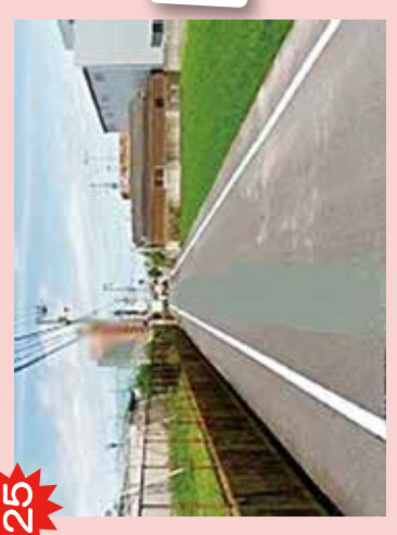
25 愛太グラウンド北 交通量多い、道幅狭く、歩道なく危険。