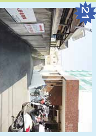
姫原ハイツ地下駐車場 通りの抜けは危険。