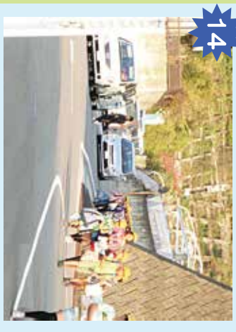
学校前道路 下校時に児童を迎えにきた車が止まっている。急に車が動き出したり、ドアが開いたりするので注意が必要。