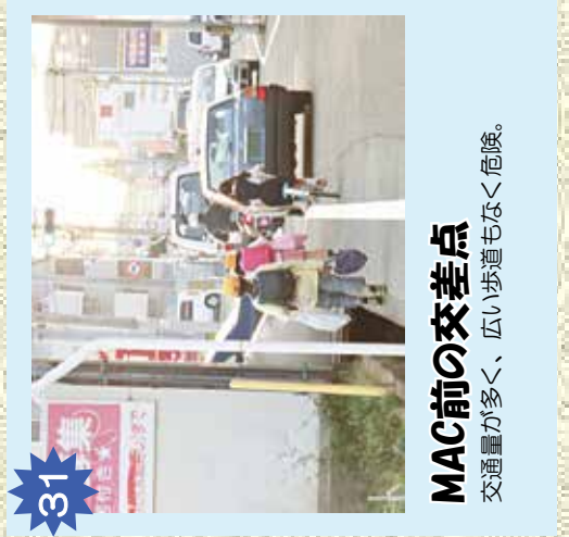
31 MAC前の交差点 交通量が多く、広い歩道もなく危険。