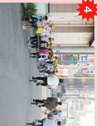
7/10センター横の大川沿い 歩行者専用ではなく、自転車や車が通るので注意が必要。