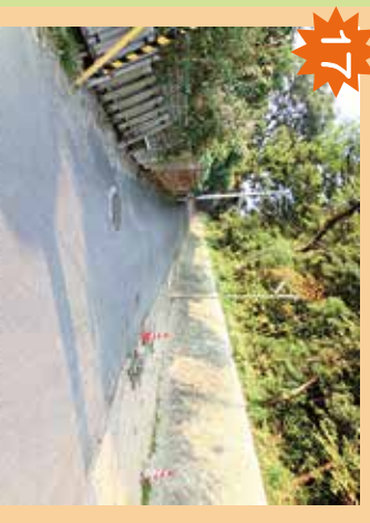
遠熊八幡神社裏の山 マスやいのししがいることがあるので危険。