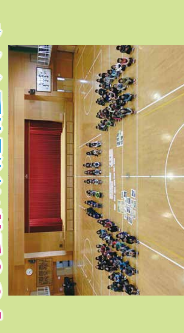
子ども交通安全の啓目まつり