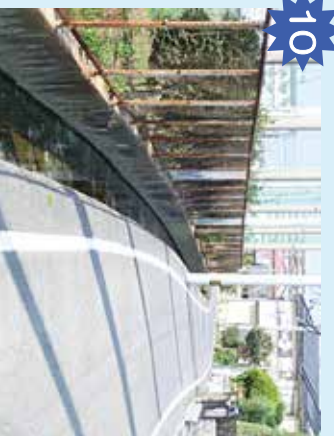
愛大運動場東側の用水路 道路幅が狭いところに溝あり。車ごとすれ違ったときに落ちる可能性あり。