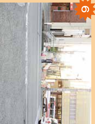
ハートナ南の坂道 車がいっぱい通る場所。歩道もない。坂になっただけで自転車のスピードの出し過ぎに注意。