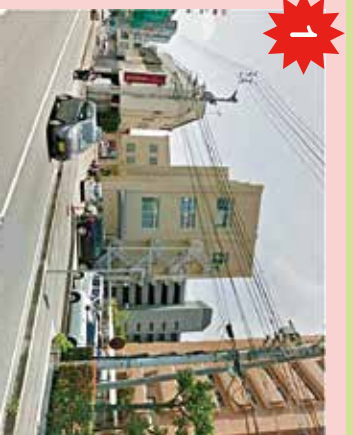
ライオンズMS横 横断歩道の間に数メートル行かないといけないため、直接道路を横断してしまいがちで危険。