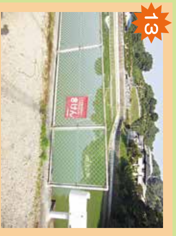
姫池 安全な足場がない、釣りも禁止。