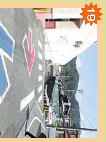
スーパーファミ姫原地下駐車場 通り抜けは危険。地下は暗く、車や不審者に注意。

二人乗りをしません。 自転車でもならんで走るとはしません。 まわりが暗くなったら、かならずライトをつけます。 交差点では、一度とまって右と左の安全を確認します。 左側を通ります。