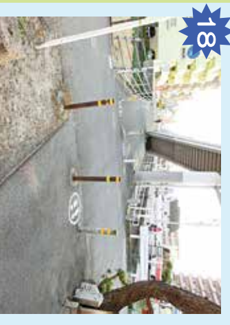
歩道橋下 急に車が通ることがある。ストロークで安全がとれない。