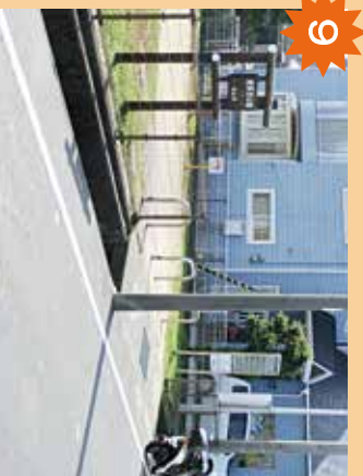
姫原西公園出入口 交通量が多く危険。飛び出しがちなためで危険。