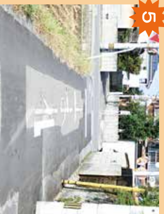
交差点 真横から来る車が見えにくい。一時停止をせずにとび出すと大変危険。