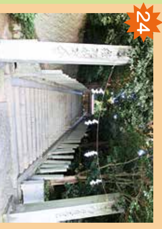
遠熊八幡神社 不審者が出る可能性がある。人通りが少なく、主体的に帰る。