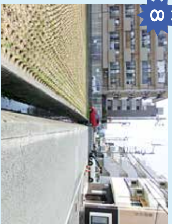
用水路 用水路が深く、落ちると危険。