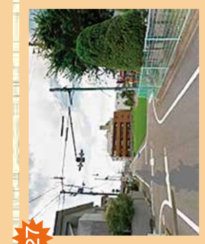
27 山越公園南交差点 近くに交差点が多く、事故が多発。