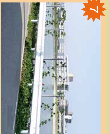
角田池 舟を着ている養魚池。釣りは禁止。