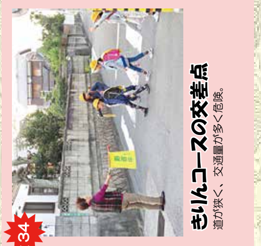
34 さりんコースの交差点 道が狭く、交通量が多く危険。