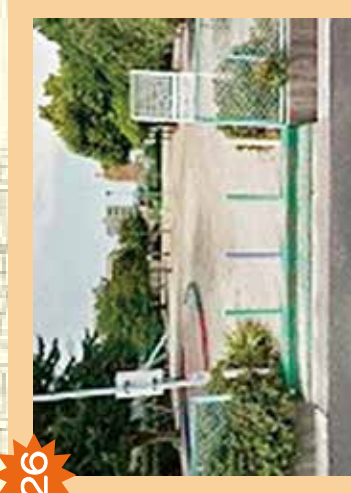
26 丁地公園 遊び方や持ち物の管理について注意が必要。