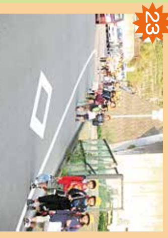
学校前坂道 急な坂道。自転車のスピードに注意が必要。