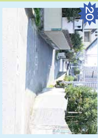
狭い道 車がギリギリ通れるくらい狭い道のり。