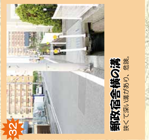
32 郵政宿舎横の溝 狭くて深い溝があり、危険。