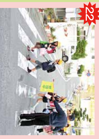
学校西の横断歩道 車の通りが多い。