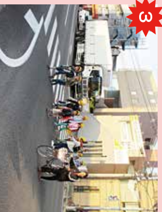
NTT前の横断歩道 自転車や車が多く通る。信号が青でも、車が右折してくるので危険。また、大川沿いにストロークがあるので活用。