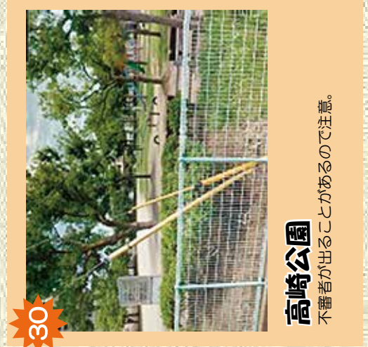
30 高崎公園 不審者が出るので注意。