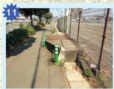
水路の出っ張り 歩道の幅の半分くらい出っ張っているの、自転車とすれ違うときは気をつけよう（一列で歩こうね）。