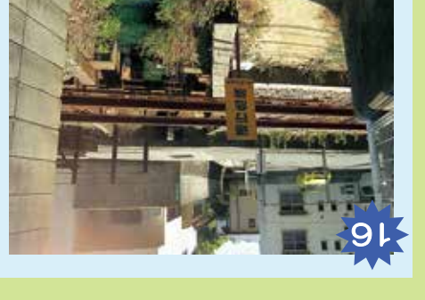
16 線路近の細道 線路には絶対に入らないようにしよう。線路には絶対に入らないようにしよう。