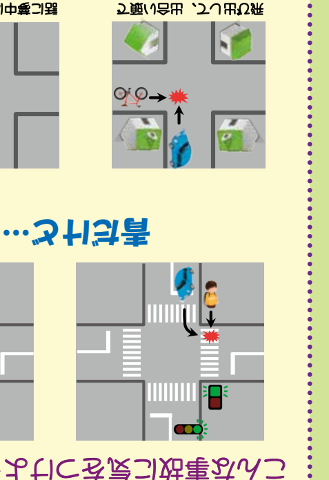
青だけで... 横断歩道を安全に渡ると、右折・左折して来た車や信号を無視して来た車と、ぶつかることがあるよ!