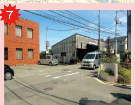
北四国エアコン前横断歩道 車がスピードを出して通っていることがよくあるから気をつけて渡ろう。