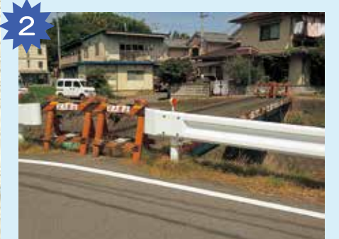
立ち入り禁止の橋 ガードレールのない土手道だよ。落ちたら危ないから、絶対に入らないようにしようね。