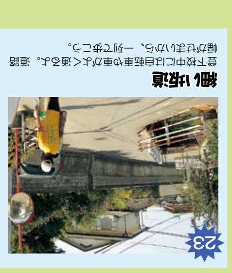
23 細い坂道 登下校中には自転車がたむき通る。道路幅が狭いから、危ない。登下校中には自転車がたむき通る。道路幅が狭いから、危ない。