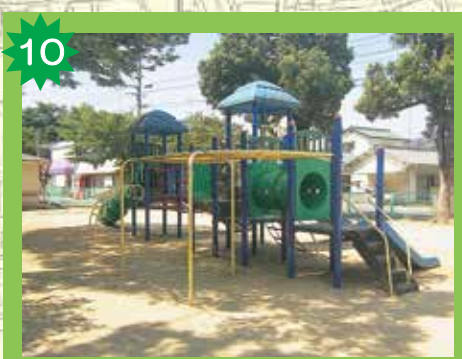
星ヶ岡公園 遊具がたくさんあるし、いろいろな花も咲いていてきれいな公園だよ。星岡山の下にあるけれど、一人では登らないようにしようね。