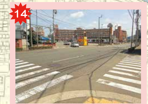
ペットStep横の横断歩道 三叉路になっているし、環状線は交通量も多いから、横断歩道を渡るときは気をつけよう。