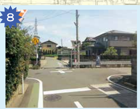
坂道の十字路 自転車に乗っている人も歩いている人も、必ず一回止まって、周りをよく見よう。