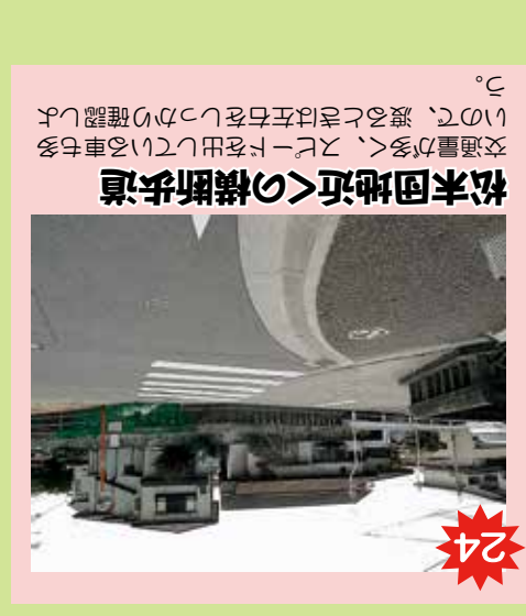
24 松本団地近の横断歩道 交通量が多く、また車を出入りしている車も多いため、渡る時は左右をよく確認しよう。交通量が多く、また車を出入りしている車も多いため、渡る時は左右をよく確認しよう。