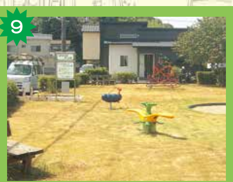
星岡新団地第一公園 芝生のきれいな公園で、遊具で遊べるよ。生き物もたくさんいるよ。