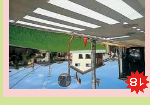
18 愛信車体前近の横断歩道 国道の抜け道になっているから、車が多い。左右をよく確認してから渡ろうね。国道の抜け道になっているから、車が多い。左右をよく確認してから渡ろうね。