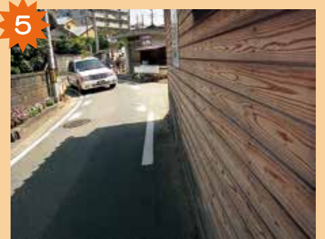
天山郵便局の前 道もせまいし、見通しの悪い交差点だよ。車もよく通るから気をつけて歩こう。