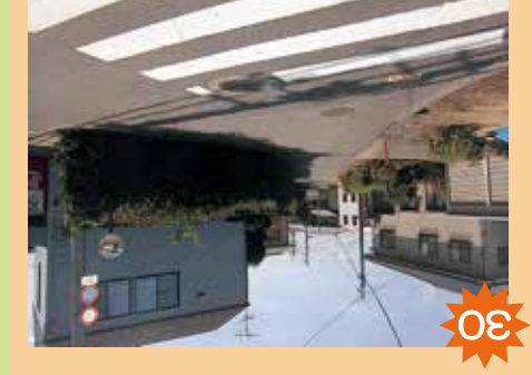
36 城南高校の二ノコト付近 左の見過しが多いから、カーミラーをよく見て気を付けて。左の見過しが多いから、カーミラーをよく見て気を付けて。