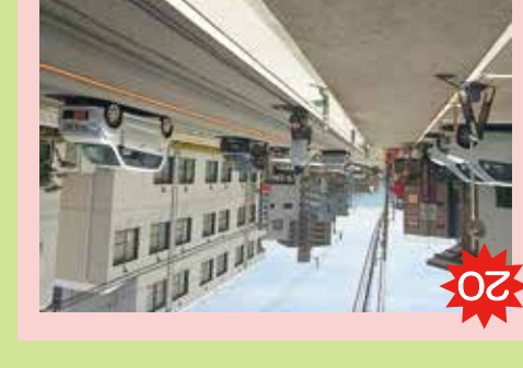
20 松山城東病院の周辺(県道) 歩道の幅が狭い。また、バスやトラックなどの大型車が通るから危ない。歩道の幅が狭い。また、バスやトラックなどの大型車が通るから危ない。