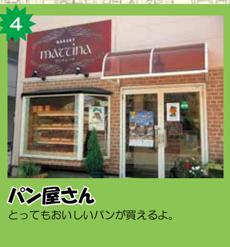
パン屋さん とってもおいしいパンが買えるよ。