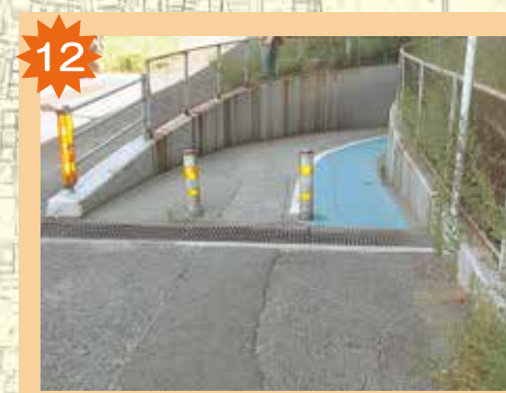
線路下の坂道 朝は自転車やバイクがたくさん通るから、一列で気をつけて歩こうね（特に自転車のスピードの出し過ぎに注意しよう）。