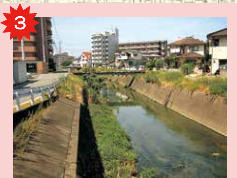
川附川の道路 車が見えにくくなっているし、交通量も多いので、気をつけて歩こう。