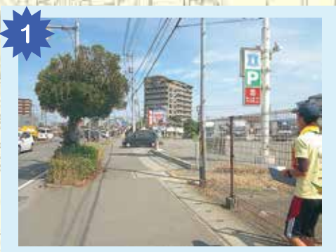
ローソンの前 ローソンの店員さんが、みんなの安全を見守ってくれているよ。