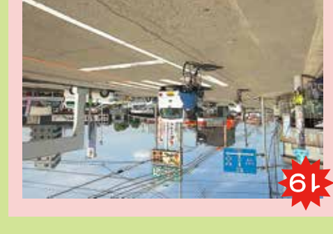
19 ヲタマツツの周辺(県道) 交通量が多い。また、バスやトラックなどの大型車が通るから危ない。交通量が多い。また、バスやトラックなどの大型車が通るから危ない。