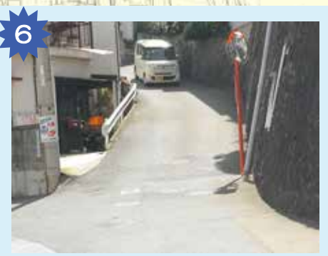
急な坂道 坂道を下るときはスピードを出さないようにしよう。見通しの悪い道路と合流しているから危険だよ。