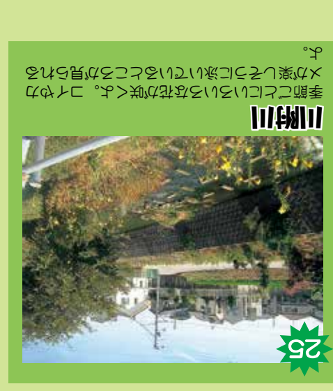
25 川附川 季節ごとにいろいろな花が咲く。カーミラーが壊れていたり、いろいろな方向から自転車が通るから危ない。季節ごとにいろいろな花が咲く。カーミラーが壊れていたり、いろいろな方向から自転車が通るから危ない。