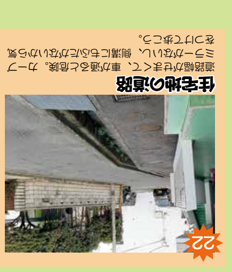
22 住宅地の道路 道路幅が狭い。車が通ると危険。カーミラーがないし、側溝にぶつかる危険があるから気を付けて。道路幅が狭い。車が通ると危険。カーミラーがないし、側溝にぶつかる危険があるから気を付けて。