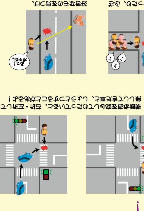
こんな事故に気を付けてよう! 飛び出して、出合っただけでぶつかることがあるよ! 飛び出して、出合っただけでぶつかることがあるよ!