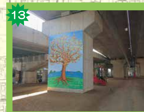
福音公園 福音小のお友達がかいたパネルがあるよ。遊具やバスケットコートなどがあって、雨が降っても遊べるよ。でも、暗くなる前には帰ろうね。