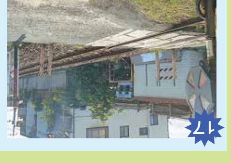
17 福音小学校西門近の踏切 登下校の時も通る踏切だよ。電車が来ると、危ない。登下校の時も通る踏切だよ。電車が来ると、危ない。