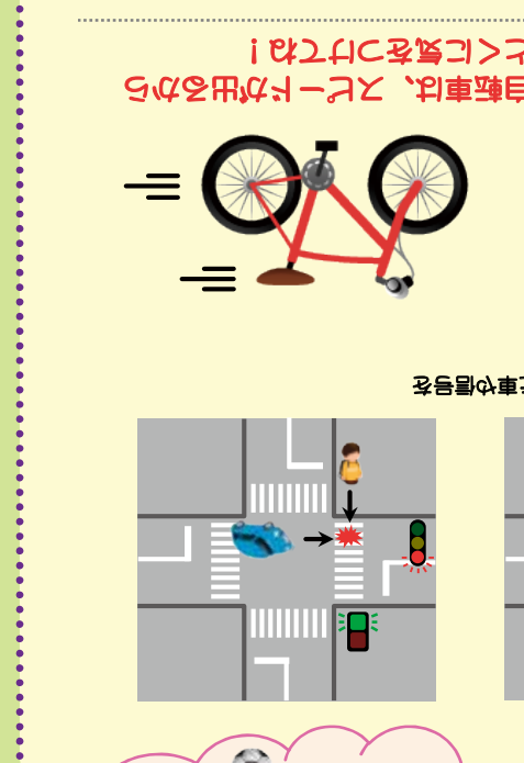
子ども交通安全マップ 子ども交通安全マップ