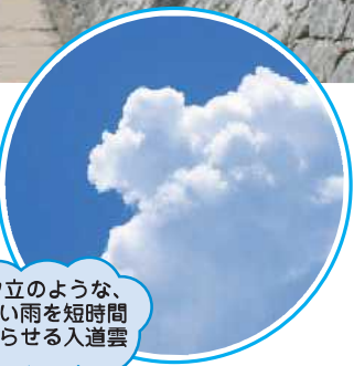
夕立のような、 強い雨を短時間 降らせる入道雲