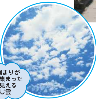
小さな固まりが たくさん集まった ように見える ひつじ雲