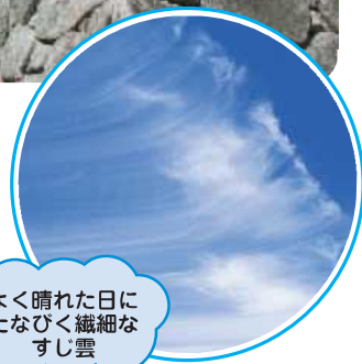
よく晴れた日に たなびく繊細な すじ雲