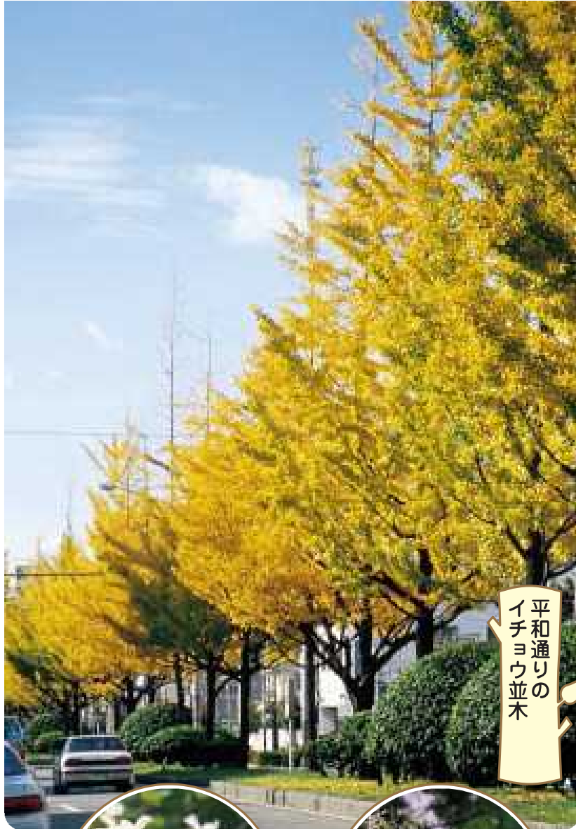
平和通りの イチヨウ並木