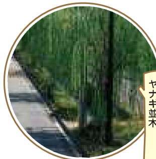
中之川通りの ヤナギ並木