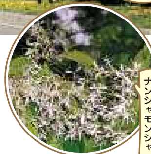
ロープウェイ街の ナンジャモンジャ

中之川通りのヤナギ、平和通りのイチヨウ、千舟町通りのプラタナス、ロープウェイ街のナンジャモンジャ、古川はなみずき通りのハナミズキ……。夏には涼しい木陰を作り、秋には季節の彩りで私たちの目を楽しませ、冬に葉を落とすものは日差しをとりこみ街を暖めてくれる――街路樹は、まさに街のオアシスです。街路樹に使われている樹木は、大地から吸い上げた水を天空へと蒸散させる水柱としての役割も果たしています。今も、目に見えないたくさんの方が水が水蒸気となって天に向かって立ち上っています。