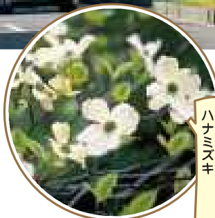
古川はなみずき通りの ハナミズキ