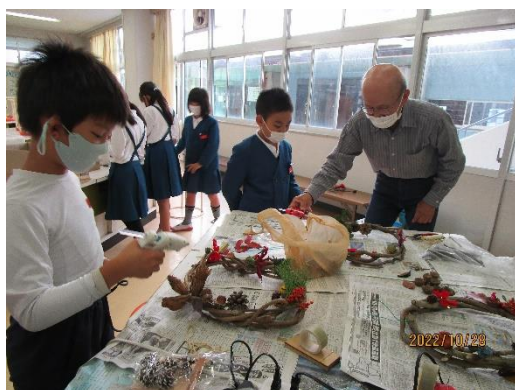
【資料1 リースづくり体験】

この取組では、校区内の名人に弟子入りし、様々な技を伝授していただく活動を行った。