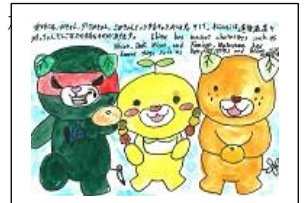
写真4 愛媛の紹介絵はがき

生徒たちは交流事業を通して、将来、台北を訪問したいと考えたり、コミュニケーション能力の大切さに気付いたりすることができた。この経験を生かし、さらにグローバルな視点に立った活動を進めていきたい。