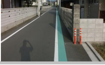
H30【NO. 1】 済

(状況) 脇道から大きい道 路へ出る場所で、自 動車や自転車の交 通量が多い箇所 です。 (対策) グリーンベルトを延 長して設置しまし た。