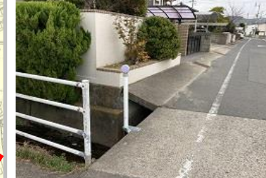
R3【NO. 102】 済

(状況) 道路横に水路があ り、ガードパイプ等 がありません。 (対策) 地域と関係団体の協 議に基づき、デリネ ーターを設置しまし た。