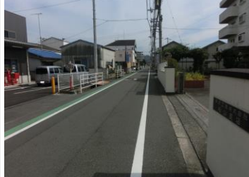
H29【NO. 1】 済

(状況) 一部、柵のない水路 があり、落下する危 険があります。 (対策) ガードパイプを設 置しました。