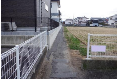
R3【NO. 104】 済

(状況) 脇道から大きい道 路へ出る場所で、自 動車や自転車の交 通量が多い箇所 です。 (対策) グリーンベルトを延 長して設置しまし た。