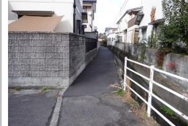
R3【NO. 101】 済

(状況) 道幅が狭く、舗装が されていません。 (対策) 町内会からの要望を 踏まえ舗装しまし た。