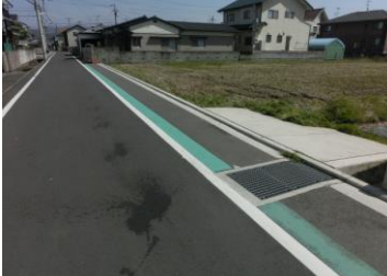
H29【NO. 3】 済

(状況) 脇道から大きい道 路へ出る場所で、自 動車や自転車の交 通量が多い箇所 です。 (対策) グリーンベルトを延 長して設置しまし た。