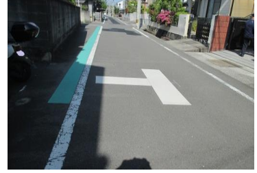
R3【NO. 103】 済

(状況) 道路横に水路があ り、ガードパイプ等 がありません。 (対策) 地域と関係団体の協 議に基づき、デリネ ーターを設置しまし た。