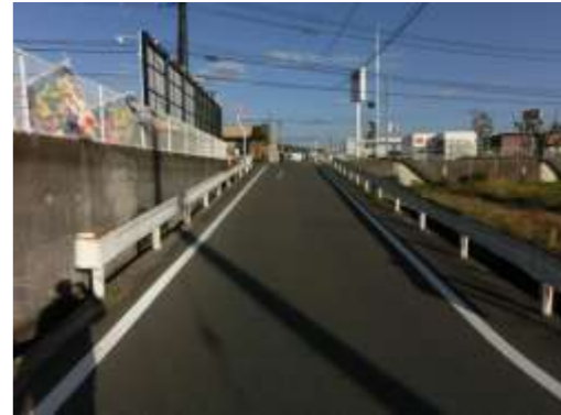
H29【NO. 3 H24-252】 済

（状況） 国道への進入路が狭く出入りの車が危険です。 （対策） 外側線を引き直しました。