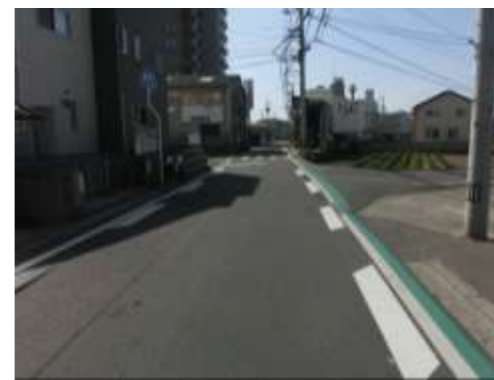
H29【NO. 2】 済

（状況） 交通量が多くスピードを出して車が通るため危険です。 （対策） グリーンバルトを設置し、減速マークを引き直しました。