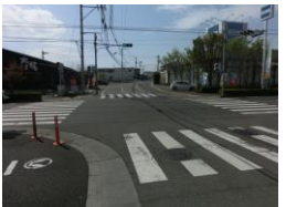
H29【NO. 1】 済