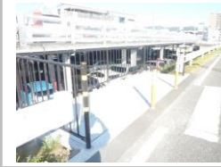
H29【NO. 2】 済

(状況) 横断歩道の待機場所が狭いため、特に雨天時に傘をさして登下校する場合に車道にはみだしてしまう場合があり危険です。