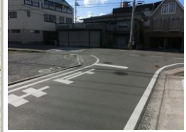
H29【NO. 6】 済