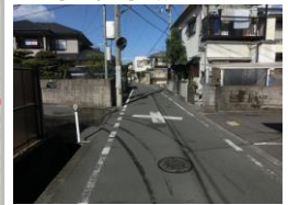
H29【NO. 4】 済