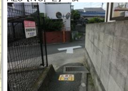
H29【NO. 21】 済