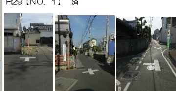
H29【NO. 1】 済