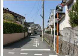
H29【NO. 7 H24-136】

（対策） ドット線・専流帯を設置しました。 外側線・横断歩道・停止線を引き直しました。