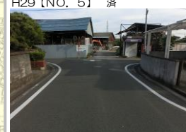
H29【NO. 5】 済