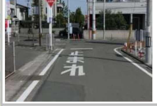
H29【NO. 5】 済

(状況) 道幅の狭い道路で、外側線などが薄くなっています。 (対策) 外側線（路側帯拡幅）・停止線・止まれを引き直しました。