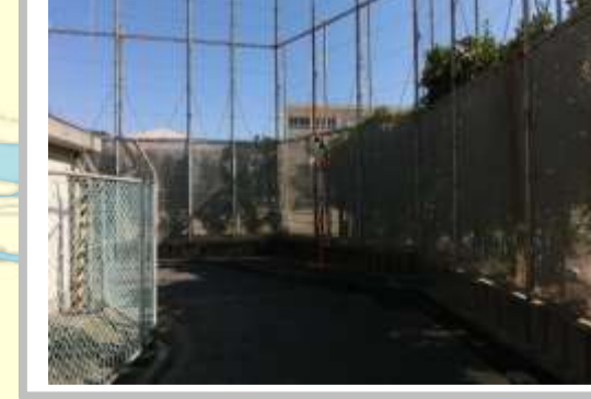
H29【NO. 6】 済

(状況) カーブで見通しが悪いため、危険です。 (対策) カーブミラーを設置しました。