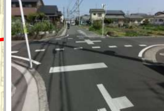
H29【NO. 4】 済

(状況) 車のスピードが速く、区画線等薄くなっています。 (対策) 外側線と交差点マークを引き直し、東西に減速マークを設置しました。