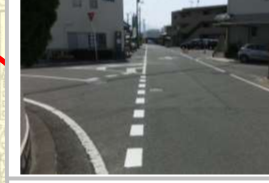
H29【NO. 3】 済

(状況) 五叉路の交差点で、色々な方向から車等が交わるため危険です。 (対策) ドット線を設置しました。