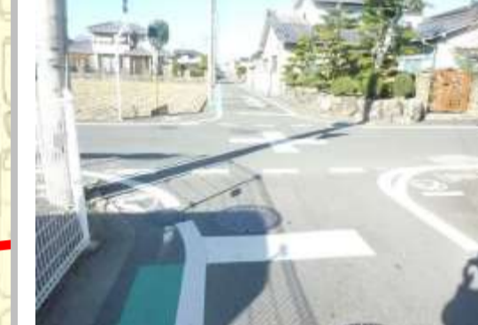
H29【NO. 1】 済

(状況) 信号のない交差点で、通行する車のスピードも速いため危険です。 (対策) グリーンパルトを設置し、外側線・ドット線・交差点マーク・停止線・止まれを引き直しました。