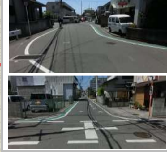
H29【NO. 4】 済

(状況) 多くの児童が通る道路で、カーブで見通しが悪く、交通量も多いため、注意が必要です。 (対策) グリーンベルトを設置し、外側線(路側帯拡幅)・交差点マーク・ドット線を引き直しました。