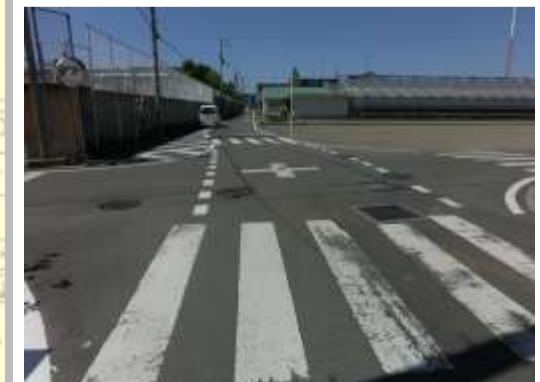
H29【NO. 5】 済

(状況) 見通しの悪い交差点で、横断する際に注意が必要です。 (対策) 外側線を引き直し、ドット線を設置しました。