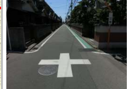
H29【NO. 3】 済

(状況) 多くの児童が通る道路で、道幅が狭いため注意が必要です。 (対策) グリーンベルトを設置し、交差点マークを引き直しました。