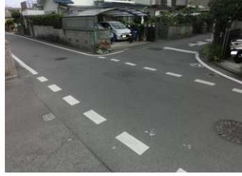
H29【NO. 5】 済

(状況) スーパーの駐車場入口があり、道幅が狭いため危険です。 (対策) 外側線を設置しました。 止まれを引き直しました。