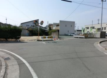
H29【NO. 11 H24-312】 済

(状況) 抜け道で通行量が多く、近隣の店舗を利用する車も多い中を、児童は横断歩道のない道路を横断して通学しています。 (対策) 横断歩道の設置は困難なためパトロールで対応しました。