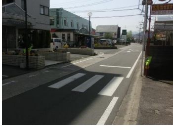
H29【NO. 9】 済

(状況) 横断歩道を渡る際、見通しが悪いため、注意が必要です。 (対策) 横断歩道を設置しました。