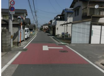
H29【NO. 2】 済

(状況) 見通しの悪い交差点で、高速道路への抜け道でもあり、交通量が多くスピードを出す車が多いため危険です。 (対策) 交差点をカラー舗装しました。