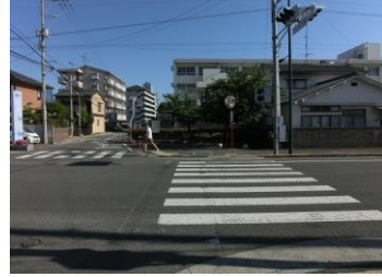
H29【NO. 4 H24-225】 済

(状況) 交通量が多い交差点で、見通しも悪い箇所です。 (対策) カーブミラーを移設しました。