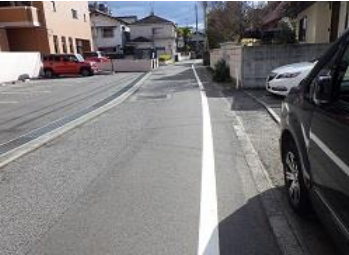
R3【NO. 101】 済

(状況) 抜け道となっており、朝の通勤の時間帯は、車がよくなり危険です。 (対策) 外側線を設置しました。