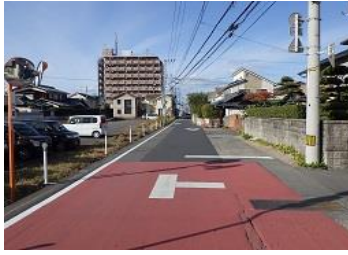
R3【NO. 103】 済

(状況) 抜け道となっており、朝の通勤の時間帯は、車がスピードを出して通るため危険です。また、横断歩道の位置が、東西の道から少しずれているため、児童の登下校の安全面に不安があります。 (対策) 交差点マークを設置し、外側線を引き直しました。 交差点をカラー舗装しました。