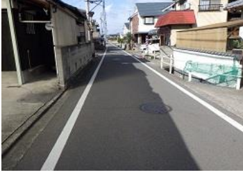
R3【NO. 105】 済

(状況) 道幅が違う変則的な四差路で、見通しが悪いです。 (対策) 交差点マークを設置し、外側線を引き直しました。