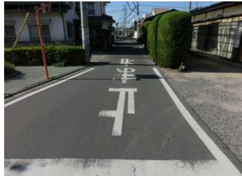
H29【NO. 7】 済

(状況) 大型店舗への抜け道で交通量の多い箇所です。 (対策) 外側線と交差点マークを引き直しました。