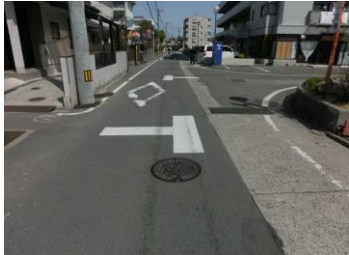
H29【NO. 6】 済

(状況) 高速道路への抜け道で、車がスピードを出して通過するため危険です。 (対策) 交差点マークを設置しました。