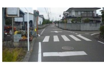
H29【NO. 10】 済

(状況) 見通しの悪い交差点で、横断歩道などが薄くなっています。 (対策) 外側線を引き直し、交差点マークとドット線を設置しました。 横断歩道・停止線を引き直しました。