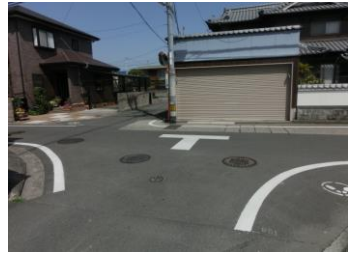
H29【NO. 3】 済

(状況) 見通しの悪い交差点で、道幅も狭いため危険です。 (対策) 外側線と交差点マークを引き直しました。