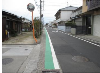
R2【NO. 1】 済

(状況) 道幅が狭く、白線が消えかかっています。 (対策) 外側線を引き直し、グリーンベルト(南側)を設置しました。