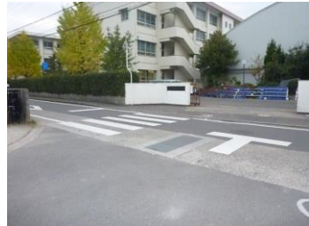
H29【NO. 8】 済

(状況) 正門前の道路で、高速道路への抜け道にもなっており交通量が多いため危険です。 (対策) 横断歩道を引き直しました。