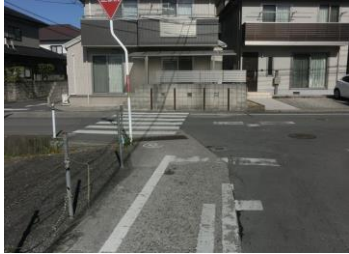
H29【NO. 1】 済

(状況) 見通しの悪い交差点で、道幅も狭いため危険です。 (対策) 外側線・交差点マーク・横断歩道予告マーク・止まれを引き直しました。 横断歩道を引き直しました。