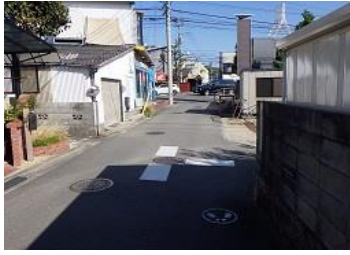
R3【NO. 102】 済

(状況) 自転車の飛び出しが多く、また、道幅が狭いです。 (対策) 交差点マークを設置しました。