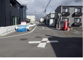
R3【NO. 104】 済

(状況) 道幅が違う変則的な四差路で、見通しが悪いです。 (対策) 交差点マークを設置し、外側線を引き直しました。