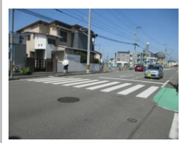
R3【NO. 105】 済

《状況》 信号を渡った後に踏切があり、電車が通るときに待っているところが道路のすぐ横になるため危険です。