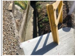
R3【NO. 1】 済