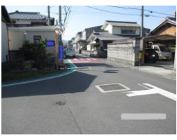
R3【NO. 101】 済

《状況》 道が狭く見通しが悪い上に、抜け道として利用する車が多く、スピードを出して走っています。