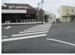
H29【NO. 2】 済

《状況》 信号のない横断歩道と踏切が隣接しており、電車通過時に待機場所が狭いため、危険です。