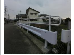
H30【NO. 1】 済

《対策》 信号機種別「通学路」の交換、外側線・止まれを引直しました。 カーブミラー設置の代替として、通学指導で対応しました。