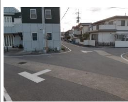
R3【NO. 104】 済