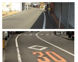
R3【NO. 102】 済