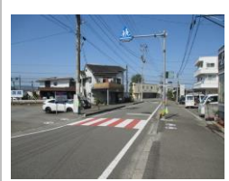
R3【NO. 103】 済

《対策》 パトロールの実施、30キロの路面標示の増設、外側線の引き直しをしました。