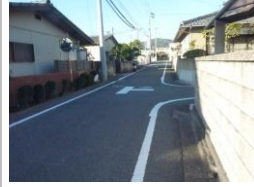
H29【NO. 3】 済