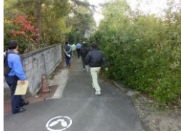
H29【NO. 1】 済