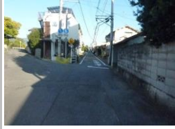
H29【NO. 5 H24-118】 済