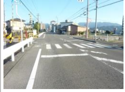
H29【NO. 4】 済

《状況》 信号のない横断歩道と踏切が隣接し、電車通過時に待機場所が狭いため、危険です。