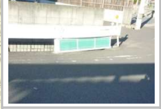
H29【NO. 1】 済

(状況) ガードレール下の舗装が一部ないため、水路に落下する恐れがあります。 (対策) 落下防止のネットを設置しました。