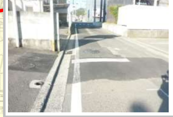
H29【NO. 7】 済

(状況) 道幅が狭く、信号待ちの車が渋滞するため、注意が必要です。 (対策) 外側線を設置しました。