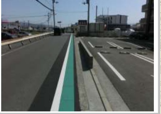
H29【NO. 4】 済

(状況) 道幅の狭く、大型車の通行が多い箇所、注意が必要です。 (対策) 外側線・グリーンパルトを引き直しました。