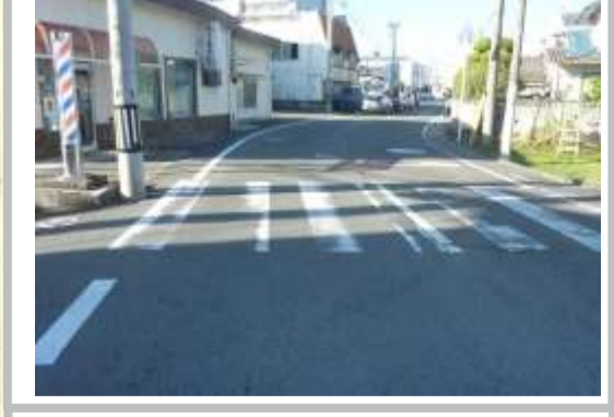
H29【NO. 3】 済

(状況) 信号待ちの車で渋滞し、交通量も多いため危険です。 (対策) ドット線を設置しました。 西側道路に外側線を設置しました。