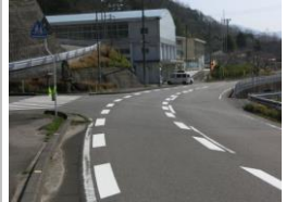
H29 [NO. 1] 済

（状況） 下り坂で、車がスピードを出して通過する箇所です。 （対策） 外側線の引き直しと、減速マーク・ドット線を設置しました。