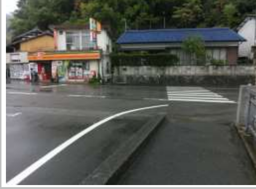
H29【NO. 4】 済

(状況) 横断歩道や外側線が薄くなっています。 (対策) 外側線と横断歩道を引き直しました。