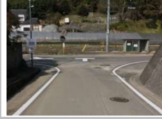
H29【NO. 7】 済

(状況) 交差点を車がスピードを落とさずに通過することがあり、注意が必要です。 (対策) 交差点マークを設置し、路側帯を拡張して外側線を引き直しました。