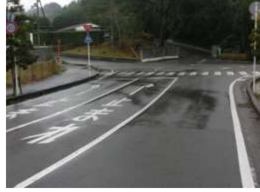
H29【NO. 2】 済

(状況) 交通量の多い道路で、外側線も薄くなっています。 (対策) 外側線を引き直し、一時停止を設置しました。