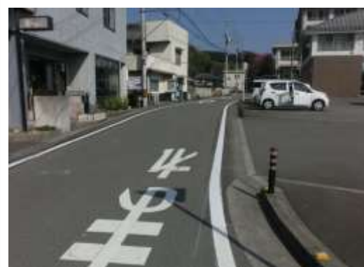
H29【NO. 6】 済

(状況) 交通量が多く、大型車の出入りが多い箇所です。 (対策) 外側線を引き直しました。