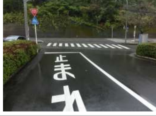
H29【NO. 3】 済

(状況) 横断歩道や外側線が薄くなっています。 (対策) 外側線・横断歩道を引き直し、一時停止を設置しました。