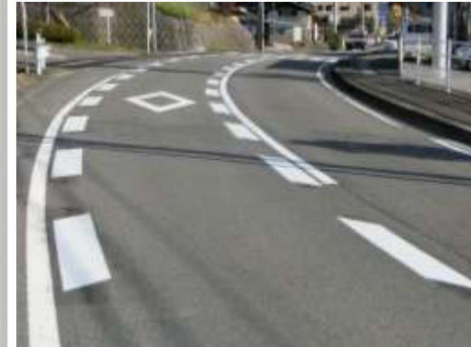
H29【NO. 9】 済

(状況) 横断歩道はあるが、交通量が多く、横断する際に注意が必要です。 (対策) 減速マークを設置し、中央線を波線から実線に変更して引き直しました。