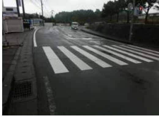
H29【NO. 1】 済

(状況) 交通量の多い交差点で、横断歩道など薄くなっています。 (対策) 外側線・横断歩道を引き直しました。