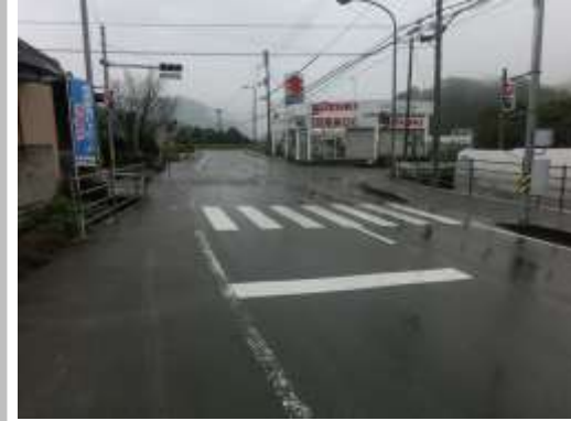
H29【NO. 8】 済

(状況) 点滅信号のある交差点。横断歩道が薄くなっています。 (対策) 横断歩道を引き直しました。