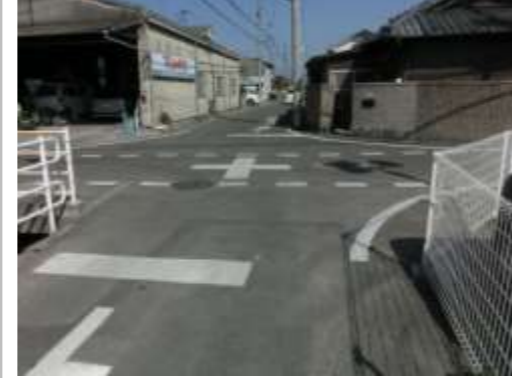
H29【NO. 3】 済

(状況) 登下校時の交通量が多く道幅も狭いため、危険です。 (対策) 外側線・交差点マーク・ドット線を設置し、止まれを直しました。