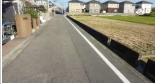
H29【NO. 2】 済

(状況) 水路のある道路で、落下する恐れがあります。 (対策) 外側線を設置（水路側）しました。