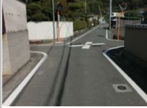
H29【NO. 4】 済

(状況) 新空港通りから抜け道として利用する車が多く、道幅も狭いため、危険です。 (対策) 外側線・交差点マークを引き直しました。横断歩道予告マークの引き直しについては一時停止とまれ文字があるので補修しない。