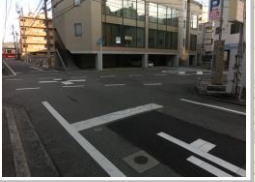
H29【NO. 4】 済

（状況） 五叉路の交差点で、いろいろな方向から車が通行するため危険です。 （対策） 区画線等（交差点マーク・ドット線・ゼブラ）を設置しました。止まれを引直しました。