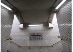
H29【NO. 3 H24-194】 済

（状況） 地下道で人の目が届きにくく、防犯上の不安があります。 （対策） 地下歩道の照明を交換し、防犯ミラーを設置しました。