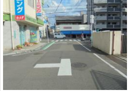
H29【NO. 1】 済

（状況） 通学時間帯の交通量が多く、横断歩道を渡るときに注意が必要箇所です。 （対策） 交差点マークとグリーンベルトを設置しました。横断歩道を引き直しました。