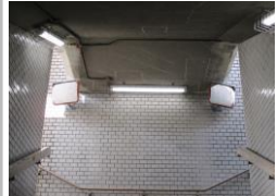
H29【NO. 2 H24-193】 済

（状況） 地下道で人の目が届きにくく、防犯上の不安があります。 （対策） 地下歩道の照明を交換し、防犯ミラーを設置しました。