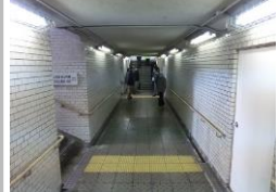
H29【NO. 3 H24-194】

〔状況〕 地下道で人の目が届きにくく、防犯上の不安があります。 〔対策〕 地下歩道の照明交換と、防犯ミラーの設置を予定しています。