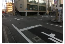
H29【NO. 4】 済

〔状況〕 五叉路の交差点で、いろいろな方向から車が通行するため危険です。 〔対策〕 区画線等（交差点マーク・ドット線・ゼブラ）を設置しました。 止まれを引き直しました。