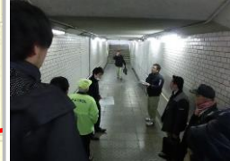
H29【NO. 2 H24-193】

〔状況〕 地下道で人の目が届きにくく、防犯上の不安があります。 〔対策〕 地下歩道の照明交換と、防犯ミラーの設置を予定しています。