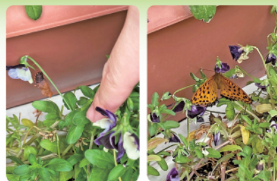
ツマグロヒョウモンの蛹がかえって蝶になりました！