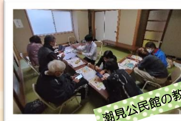
潮見公民館の教室