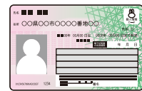
マイナンバーカード 等