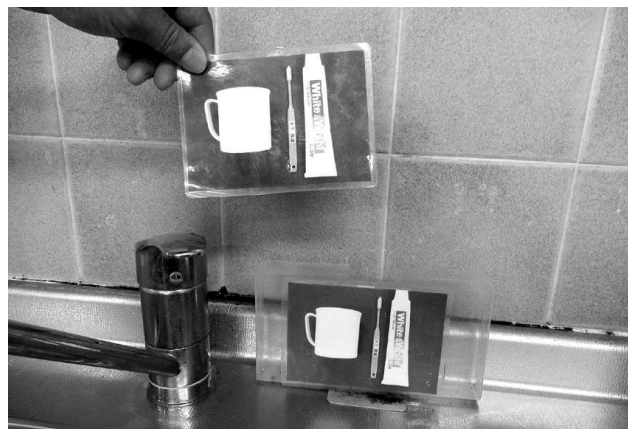
写真カードを使った手順と場所のマッチングの例