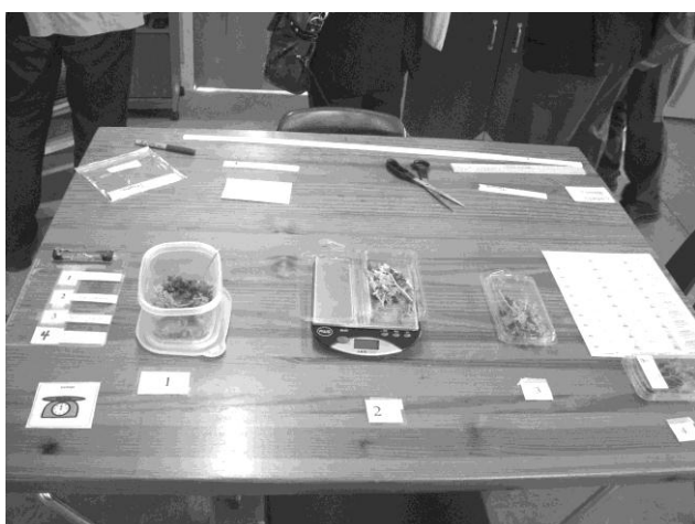
ハーブを計量機で計ってパッキングする作業の手順の提示