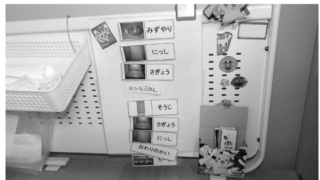
文字と写真によるスケジュール提示の例