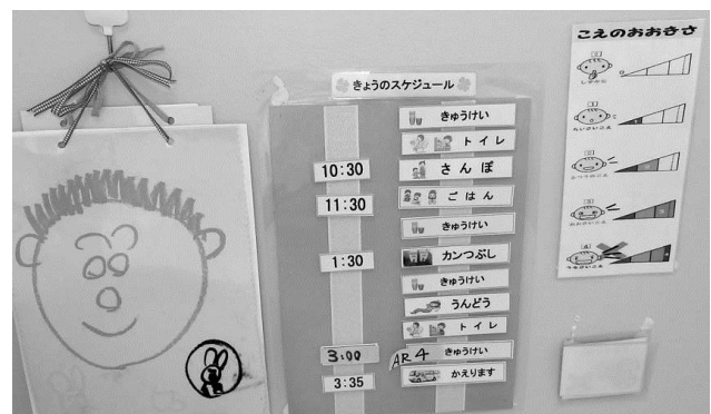
文字と絵によるスケジュール提示 声の大きさも視覚化

「いつ」「どこで」「なにを」という情報を、文字や絵、写真など、または実物等、一人ひとりの理解レベルに応じてスケジュールを提示します。また、提示の範囲も、1日単位から半日単位、次の予定のみ等、利用者の理解度によって提示します。スケジュールの意味理解ができてくると、変化が苦手な人でも、予めスケジュールカードを差し替えることで混乱なく受け入れることができるようになります。このように本人が理解できるスケジュールを提示することで「見通し」を持ってもらうことができます。