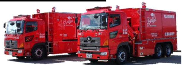
海水利用型消防水利システム