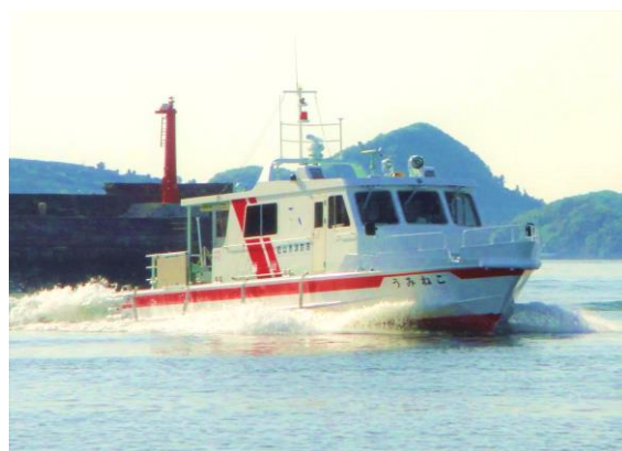
消防救急艇「うみねこ」