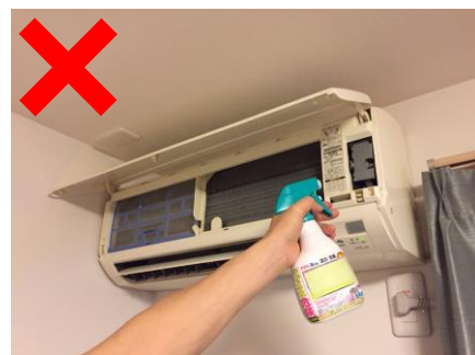
電源部分への不適切な洗浄例