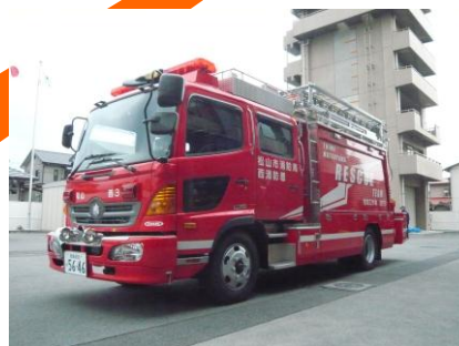
松山市救助隊配置図