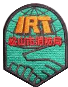
松山市国際消防救助隊員 ユニフォームのワッペン