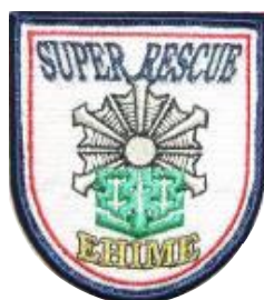
松山市高度救助隊員 ユニフォームのワッペン