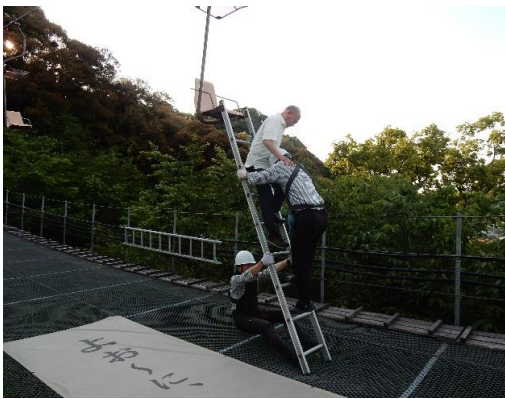
リフトの救助訓練

ロープウェイは緊急降下用具を使用して搬器からの救助訓練を、リフトはハンゴを使用した救助訓練など、様々な状況を想定した訓練を月1回以上実施しています。