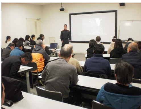
座学講習 (大規模地震の発生について等)

その他にも、平成29年2月7日には松山市東消防署の講師による、松山城職員への救命救急研修を実施しました。今回は「大規模な災害発生時の救出対応」という観点から座学、実技講習を行いました。