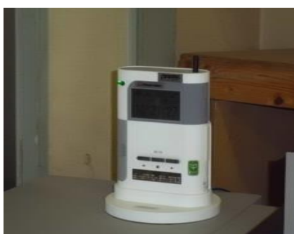
緊急地震速報受信装置 (平成24年4月より運用開始)

気象庁の「緊急地震速報制度」を活用し運転室に緊急地震速報受信装置を導入しています。速報を受信した場合、迅速に対応できるようにしています。