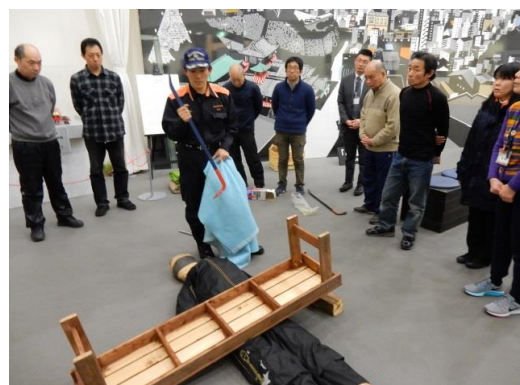
実技講習 (心肺蘇生・AED取扱い、災害時の救出方法等)