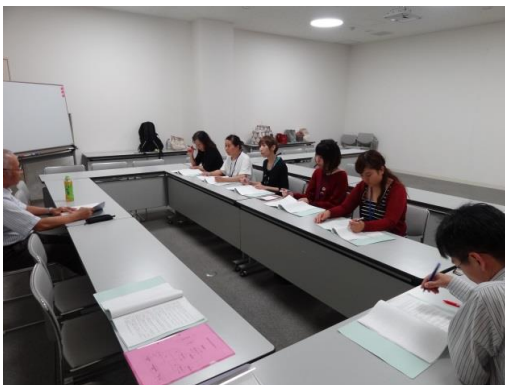
ロープウェイ乗務員対象の安全講習会

安全に関する講習(勉強会)を定期的に開催しています。実務に即した教育訓練や改善など専門的資質の向上に、また、社会情勢の変化にも迅速に対応できるように努めております。