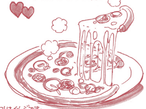
イラストは伊〜ジです。