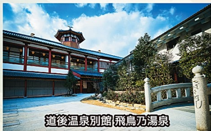
道後温泉別館 飛鳥乃湯泉