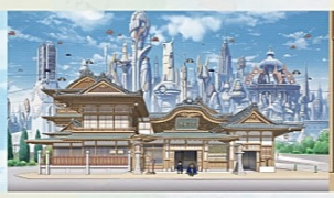
未来の道後温泉本館