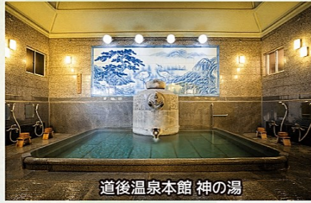
道後温泉本館 神の湯