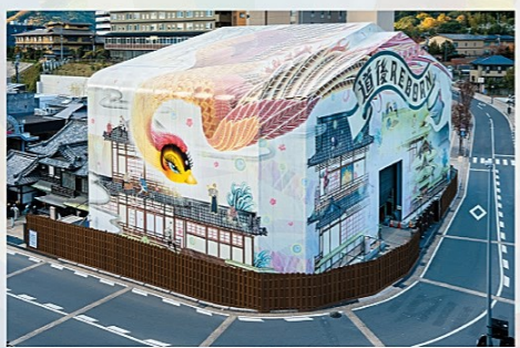
道後温泉本館 ラッピングアート