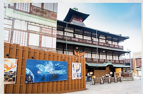
道後温泉本館 北側ウォールアート