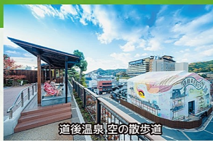
道後温泉 空の散歩道

空の散歩道では、四季折々の花や植物で季節が感じられ、足湯からは道後のまちなみやラッピングアートが眺められます。放生園は、明治24年から昭和29年まで道後温泉本館で使用した湯釜を使った「足湯」や「坊っちゃんカラクリ時計」などがあり、夜にはレトロなガス灯のともる温泉情緒溢れる人気スポットです。