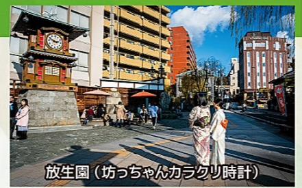
放生園(坊っちゃんカラクリ時計)