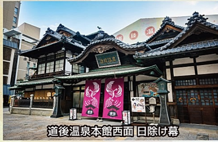
道後温泉本館西面 日除け幕