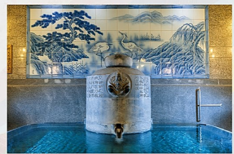
道後温泉本館 神の湯

道後温泉本館は「火の鳥」に見守られ保存修理工事中も営業中！今だけの魅力を体験しよう！！