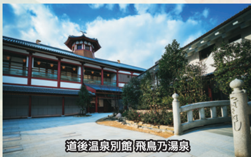
道後温泉別館 飛鳥乃湯泉