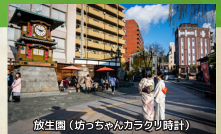
放生園(坊っちゃんカラクリ時計)