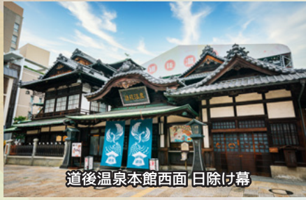
道後温泉本館西面 日除け幕