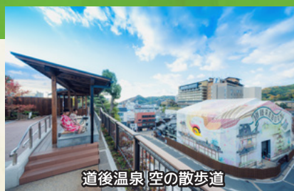
道後温泉 空の散歩道

空の散歩道では、四季折々の花や植物で季節が感じられ、足湯からは道後のまちなみやラッピングアートが眺められます。放生園は、明治24年から昭和29年まで道後温泉本館で使用した湯釜を使った「足湯」や「坊っちゃんカラクリ時計」などがあり、夜にはレトロなガス灯のともる温泉情緒溢れる人気スポットです。