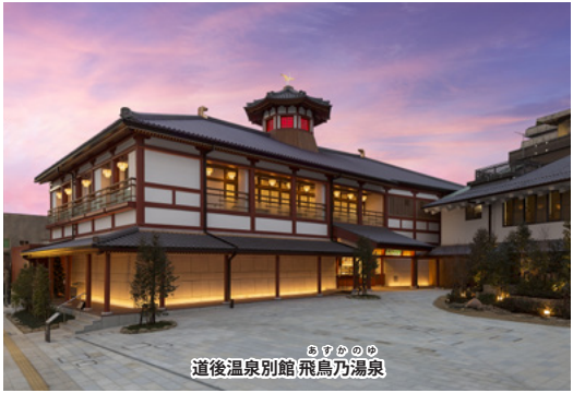
道後温泉別館 飛鳥乃湯泉