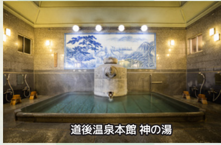
道後温泉本館 神の湯