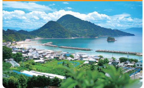
▲今回の訪問地、興居島

忽那諸島は、穏やかな瀬戸内に位置します。島内のいたる所から海が見え、小高い場所からは、瀬戸内の多島美を臨めます。