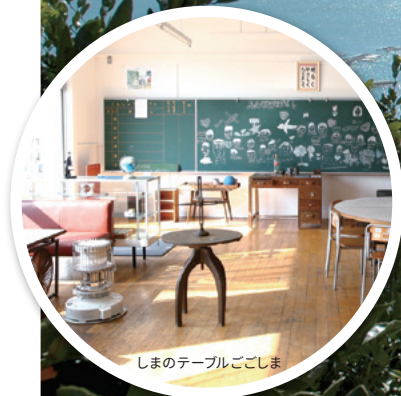
しまのテーブルごしま