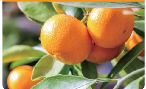
▲12月は、温州みかんの収穫最盛期です。

島しょ部の主要産業は柑橘栽培で、10月～5月まで、様々な柑橘が収穫されます。今回、先輩移住者のみかん畑で、先輩のお話を聞きながら収穫体験ができます。