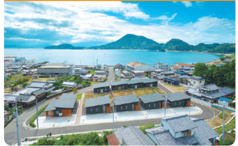
▲『ハイムインゼルごしま』

1日目は、平成29年4月にオープンしたお試し移住施設『ハイムインゼルごしま』を見学し、先輩移住者と交流します。2日目も地元の方や先輩移住者と交流会を予定していますので、たっぷり島のハウツーを教えてもらえます!