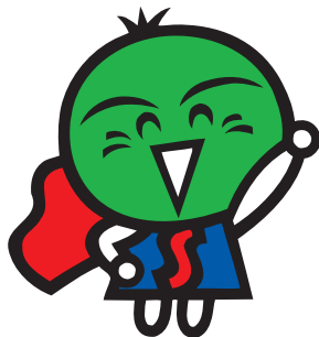
徳島県マスコット 「すだちくん」