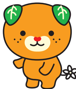
愛媛県イメージアップキャラクター 「みきゃん」