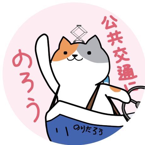
公共交通利用促進キャラクター のりたろう