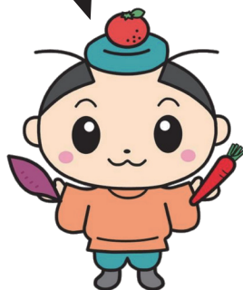
坂出市公認キャラクター 「さかいだまろ」